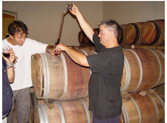
et les chais de dégustation