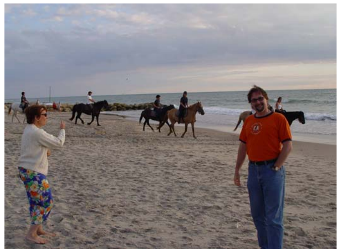
les descendants de Laporte, fondateur de la station