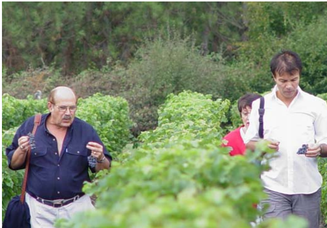
dégustation du raisin