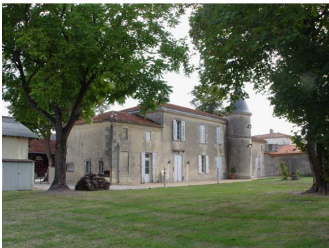
découvrez le château La Raze