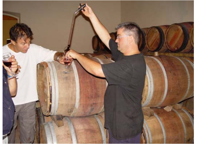
et encore une petite tournée !