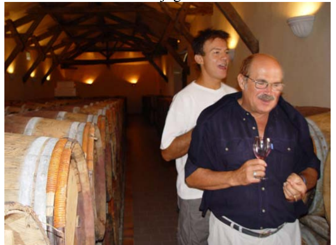
on se sent quand même mieux après