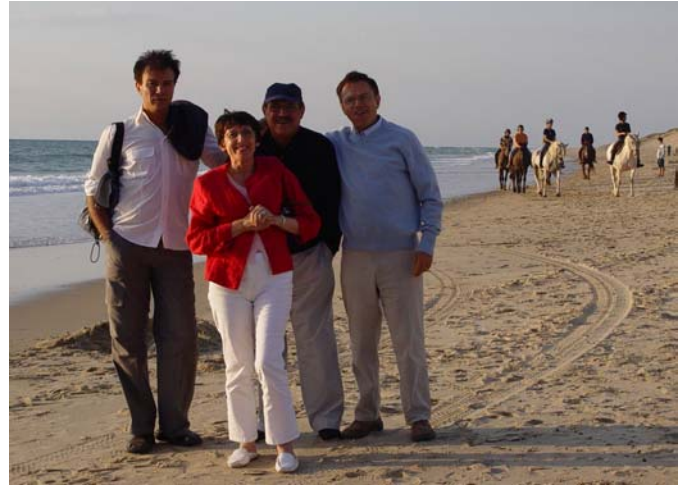
Le soir à Montalivet