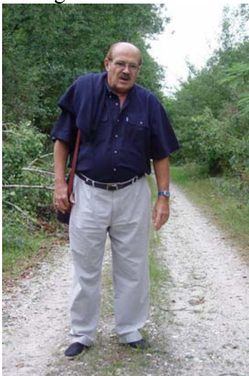
un petit coup de pompe